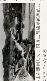
記事協力 NPO 法人 おおの風