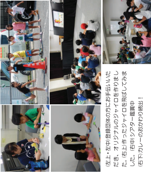
(左上・左中)登録団体の方にお手伝いいただき、オリジナルのジャイロを作りました。(右上)作ったジャイロを飛ばしてみました。(右中)シアター鑑賞中 (右下)カレーのおかわり続出！

50名(廿日市小・佐方小・平良小)の子どもたちが参加し、ペットボトルでXジャイロ作り、「おはなしスタジオ」によるブラックライトシアターの鑑賞、最後に運営協議会のメンバーお手製のカレーを食べました。あまりの勢いで、あっという間に完食しました。他校児童との交流はもちろん、団体との交流も図れた、充実した内容でした。