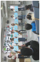
前回のステージ発表

毎年たくさんの方に応募していただき、賑わいをかせているフォトコンテマ。来春のセンターまつりでも行います。今回のテーマは「なかま」。仲間たちとワイワイガヤガヤ、仲よく楽しく活動している写真をお待ちしています。