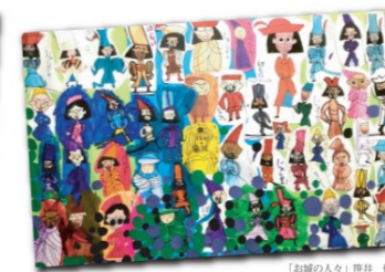
「お城の人々」 第百 芳吉

お問合せ: art201.hiroshima@gmail.com までメールください。 090-9433-8824(えびす)まで (電話が繋がらなくても後程かけなおします)