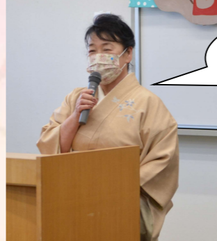
みなさん 楽しんでってください