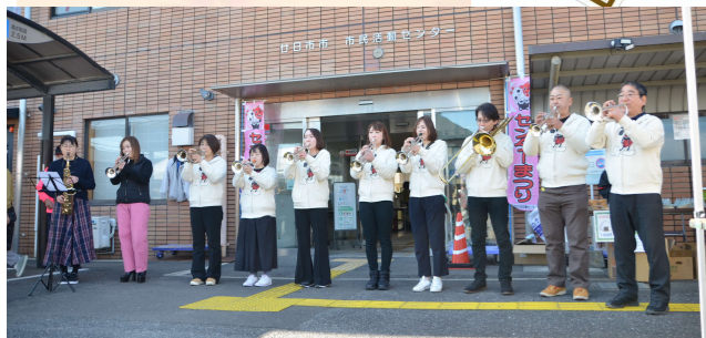
オープニングファンファーレ センターまつりが始まりますよ〜♪