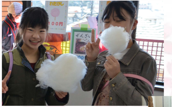
綿菓子は子どもたちに大人気! 行列がとだえませんでした