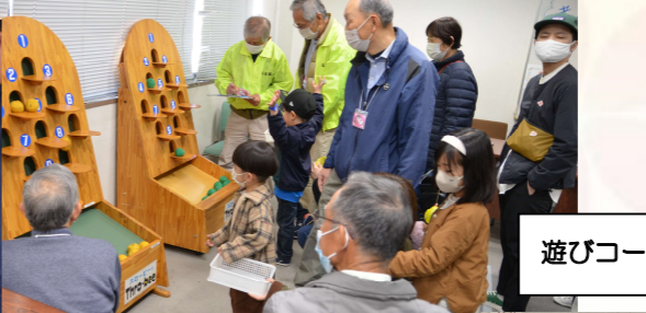
遊びコーナーも大盛況!