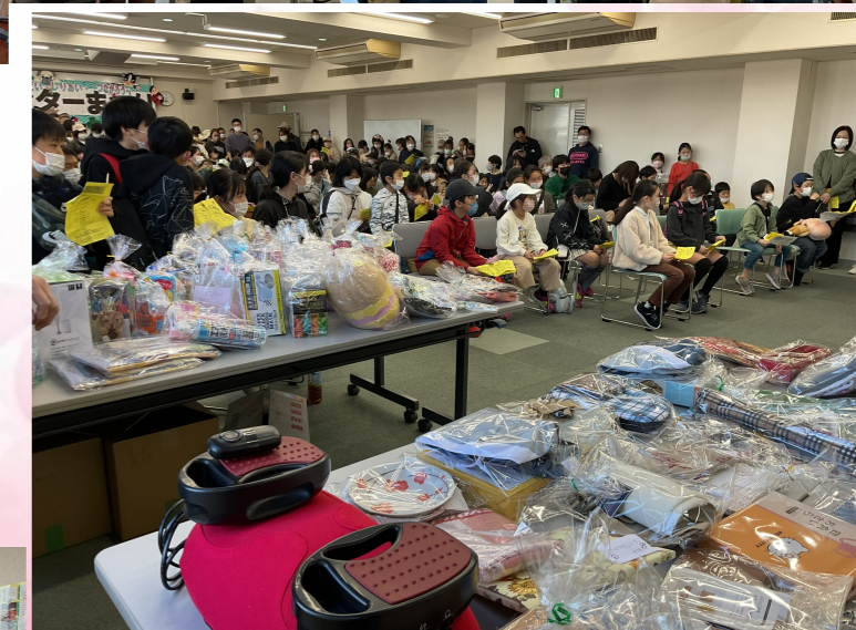
最後は、みなさんお楽しみのクイズラリー抽選会♪ なにが当たるか、ドキドキわくわく待ちきれません...