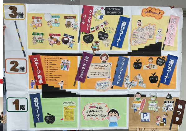
会場案内図も、わかりやすく イラストで工夫しています

ステージ発表では、ダンスに合唱、詩吟に映画、最後は ミヤジマックスも登場して大盛り上がり♪ 登録団体のみなさんの貴重な発表の機会です。