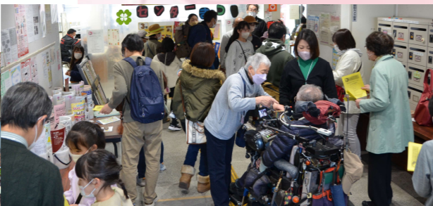
まだまだ、感染対策は万全に! 体温チェックも怠りません